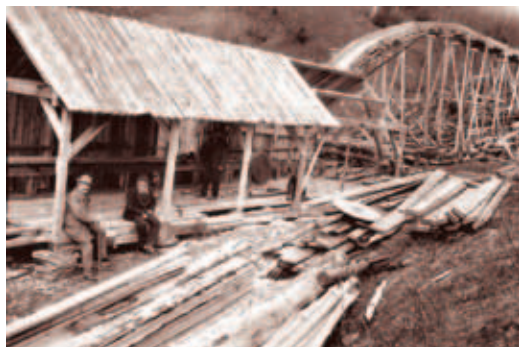
Hattfjelldal prestegårdssag under bygging våren 1910.