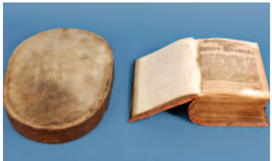
Samisk sjamaitromme. Trommen kommer fra Åsele Lappmark eller tilgrenset område. Trommen oppbevares ved Västerbotten Museum, Umeå. Eier av trommen er Statens historiska museum, Sverige. Og Bibel fra slutten av 1600-tallet.