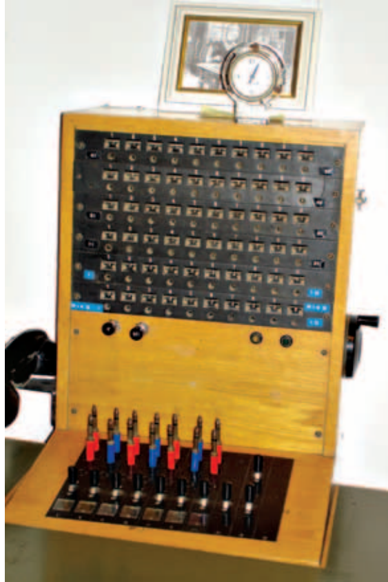
Sentralbord som ble brukt fra tidlig 1950-tallet. Avløst senere ved automatiseringen i 1960/70-årene.